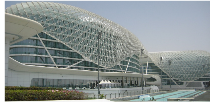
Yas Marina, UAE

Schritt für Schritt tägliche Arbeiten selbstständigeres Arbeiten neue Herausforderungen persönliche Erfahrungen sammeln