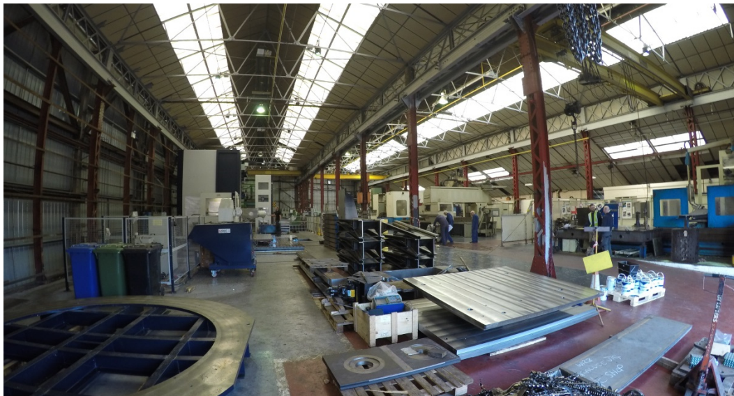
Qualter Hall, Production