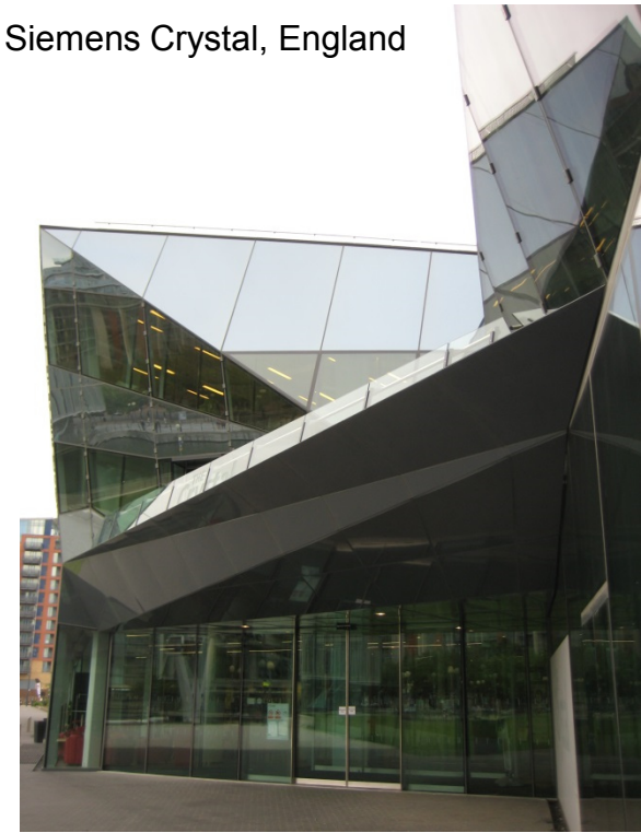
Siemens Crystal, England

Welche Bereiche gibt es / interessieren mich? Welche Firmen bieten welche Aufgaben? Recruiting-Tag