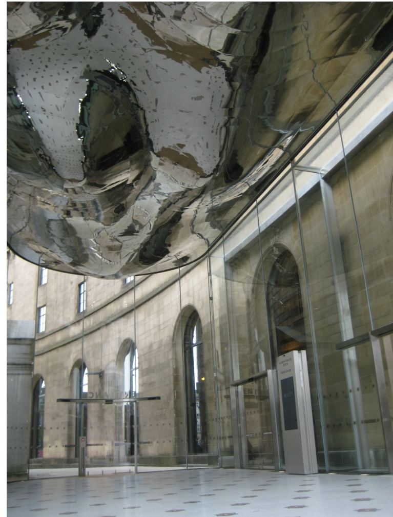
Library Walk, England

berufsbegleitendes Studium Master 2017: Abwicklung internationaler Großbauvorhaben