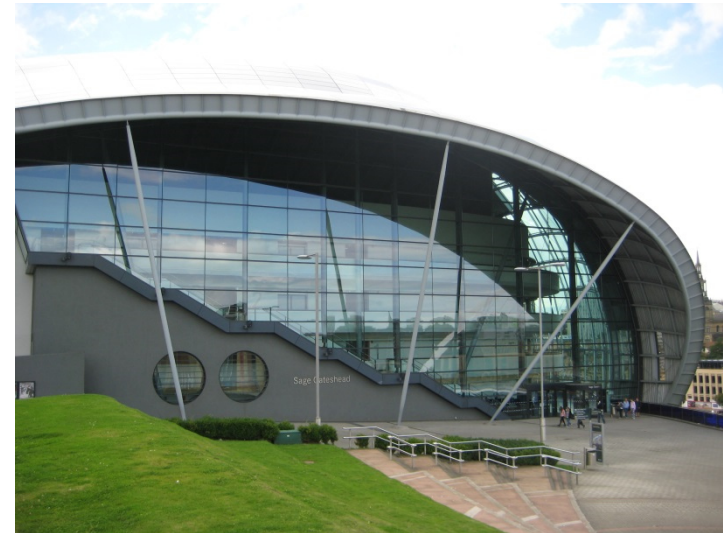
The Sage, England